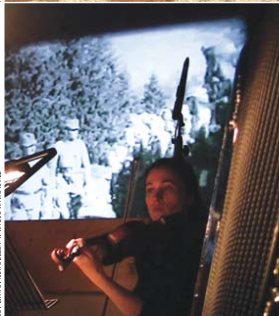
FOTO - CONCERTO "KAISERJAEGER". MUSICHE ORIGINALI PER IL FESTIVAL SU FILMATO INEDITO DELLA PRIMA GUERRA MONDIALE