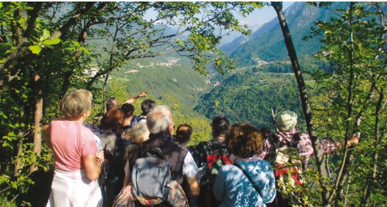
FOTO - VISITA AL FORTE PARMESAN