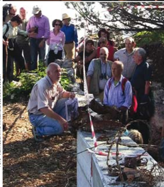
FOTO - VISITA GUIDATA AL TRINCRONE DEL MONTE ZUGNA